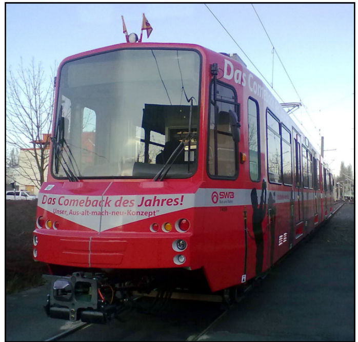
Ein modernisierte Stadtbahnwagen steht im Betriebshof Dransdorf.

Die ehemals glatte Front erhielt einen Vorbau mit Rammbohle, der auch der Sicherheit der Fahrerin und Fahrer dient. Die alte mittig geteilte Scheibe wich einer einteiligen, um die Sicht für das Personal zu verbessern.