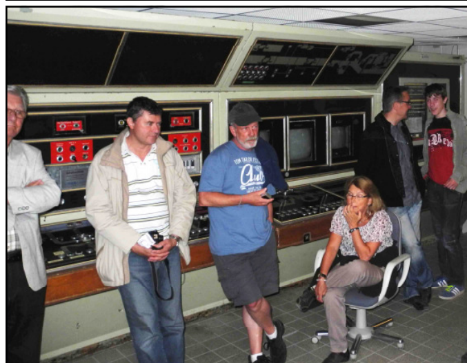
Tief unter den Ahrbergen liegt die Bunkerzentrale. Der Charme der sechziger Jahre ist nicht zu übersehen.