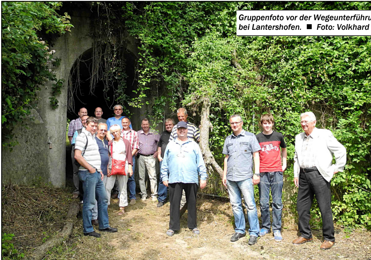
Gruppenfoto vor der Wegeunterführung bei Lantershofen.