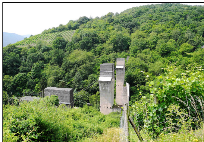
Die Pfeiler der Strategischen Bahn im Adenbachtal.