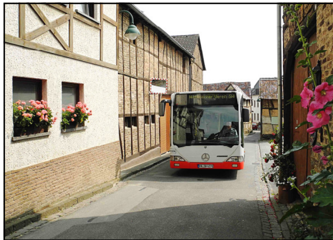
Die Ortsdurchfahrt in Lantershofen verlangte vom Fahrer sein ganzes Können.

Ein herzliches Dankeschön gilt allen, die diese Sonderfahrt organisierten und ermöglichten. (VS)